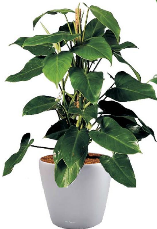
Philodendron erubescens 'Émerald Queen' Baumfreund D, R