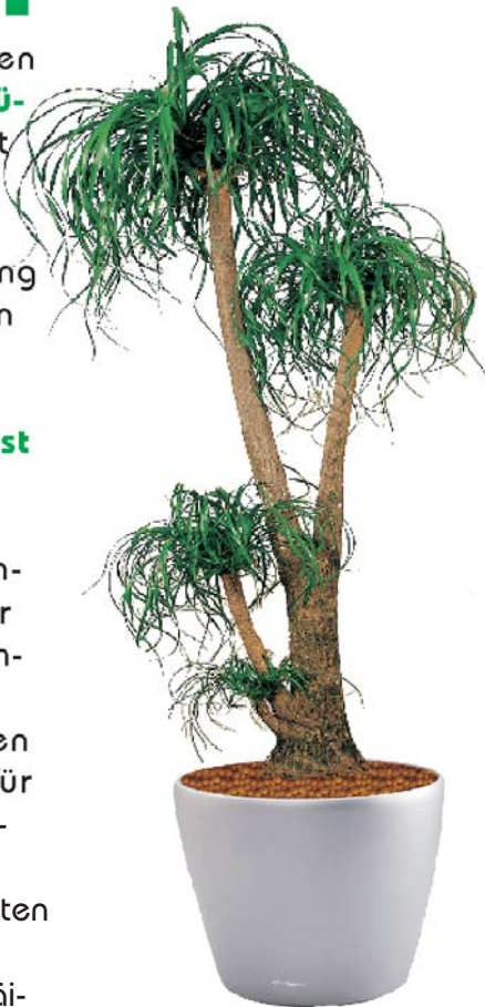
Beaucarnea recurvata Elefantenfuss

Somit können sie Ihre Innenraumbegrünung leicht selber planen, und danach mit einem Innenraumbegrünungs-fachmann besprechen.