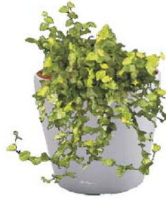
Ficus pumila Kletterfeige R, BD