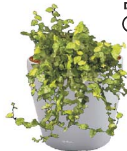
Ficus pumila R, BD ○