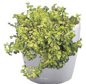
Ficus pumila 'Sonny' R, BD ○