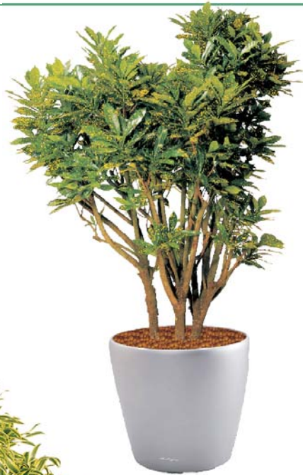
Codiaeum variegatum 'pictum' Wunderstrauch MH, D