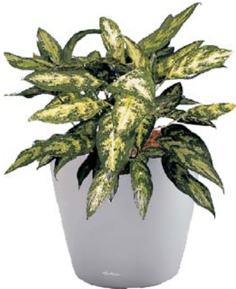
Aglaonema commutatum 'Pseudobracteatum' Kolbenfaden MH