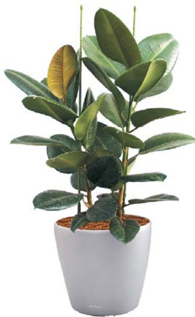
Ficus elastica 'Decora' Gummibaum D ●