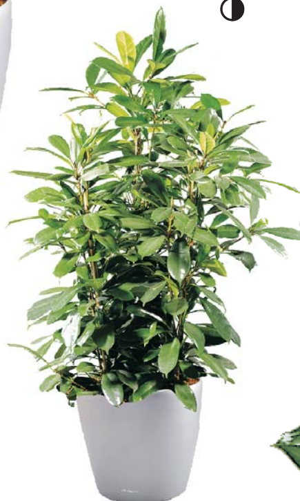
Ficus cyathistipula D, S