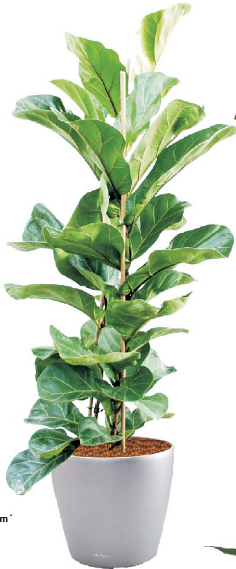
Ficus lyrata Geigenfeige D