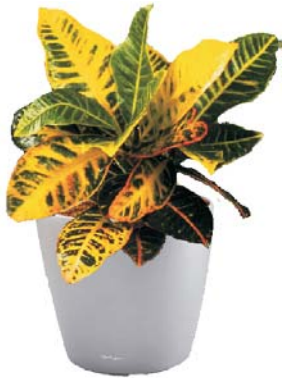
Croton variegatum Wunderstrauch MH