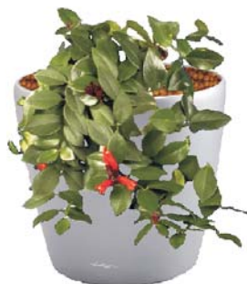
Aeschynanthus radicans Schamblume R, BD, B