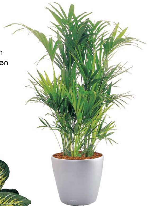
Kentia forsteriana Kentiepalme