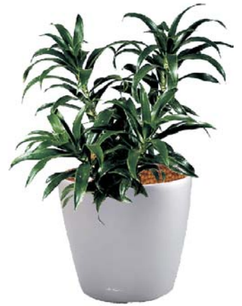
Pleomele 'Song of Jamaica' MH