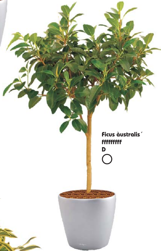
Ficus australis' FFFFFFF D ○