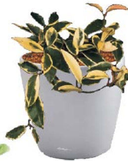
Hoya carnosa Wachsblume R, B