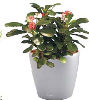
Euphorbia milii 'Gabriela' Christusdorn