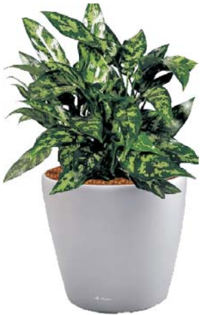
Aglaonema commutatum 'Maria' Kolbenfaden MH