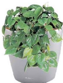
Philodendron scandens Kletterphilodendron BD, R

Redaktion: J. Binder Gestaltung: F. Prenner