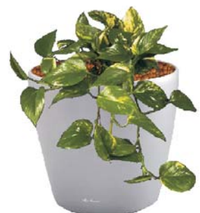
Epipremnum pinnatum Feutute BD, R