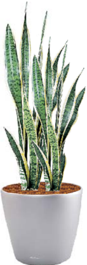
Sanseveria trifasciata 'Laurentii' Bogenhanf MH