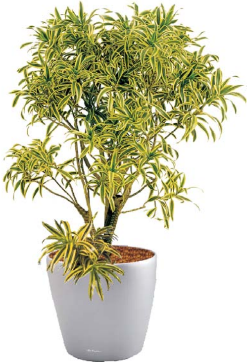
Pleomele 'Song of India' MH, D