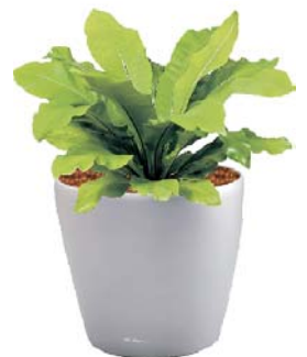
Asplenium nidus Nestfarn BD