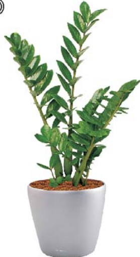
Zamioculcas zamiifolia Zamia MH