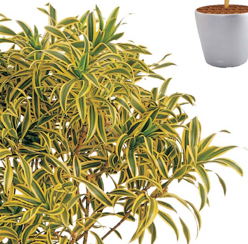
↻ Pleomele 'Song of India' MH ○