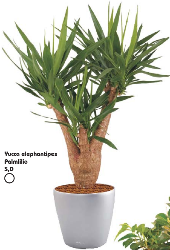
Yucca elephantipes Palmilie S,D ○