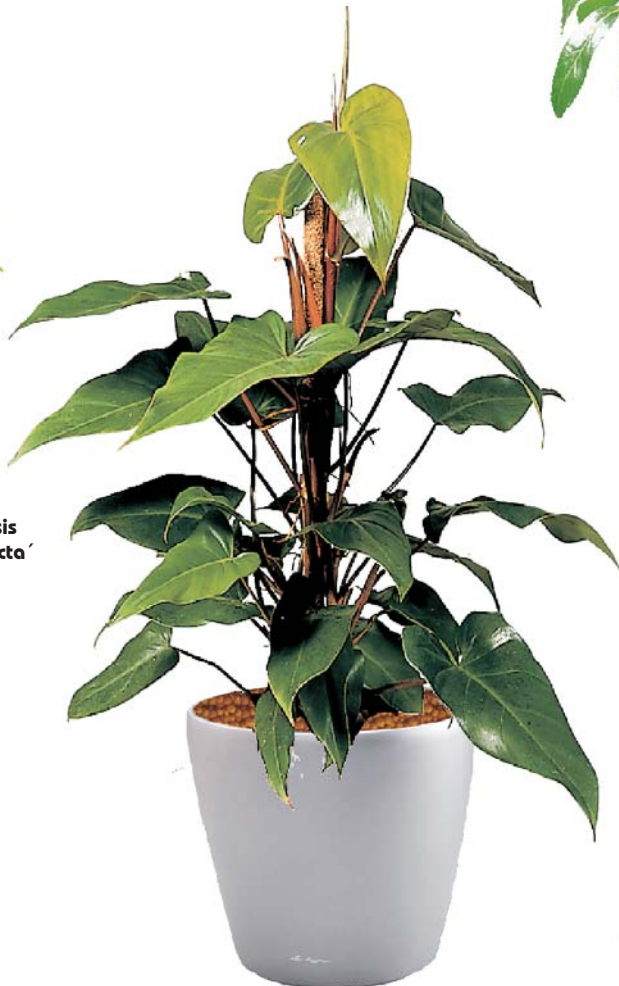
Philodendron erubescens 'Red Emerald' Errötender Baumfreund