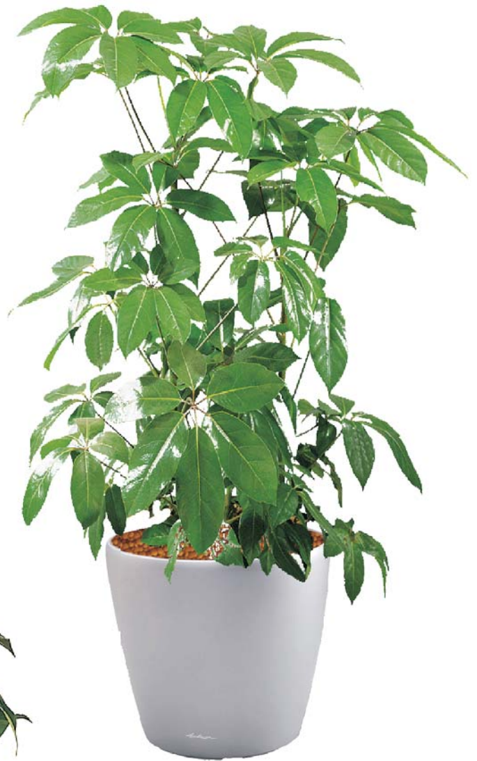
Schefflera actinophylla 'Amate' Strahlenaralie

Dieses Zusatzlicht garantiert nicht nur längere Lebensdauer und volleren Wuchs Ihrer Pflanzen, es setzt auch dekorative Akzente. So wird die Innenraumbegrünung ins rechte Licht gesetzt und verzaubert den ganzen Raum.