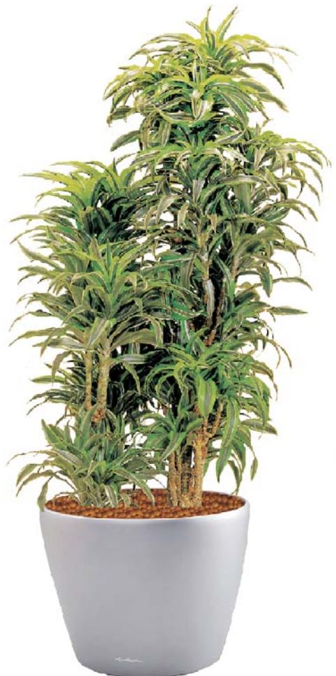
Dracaena deremensis 'Lemon' Drachenbaum MH, D, S