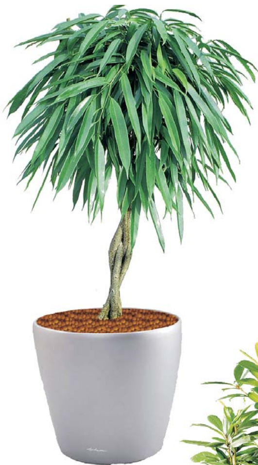
Ficus longifolia 'Alicia' D, S

Wenn Sie sich diese nicht selbst zutrauen, kann Ihr Hydro-Fachbetrieb Pflegearbeiten, wie Pflanzenschnitt, Austausch der Nährlösung, Pflanzenernährung und Schädlingskontrolle für Sie übernehmen.