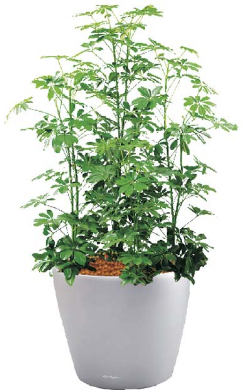
Schefflera arboricola Kleinblättrige Strahlenaralie D ●