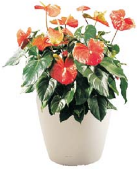
Anthurium Andreanum Flamingoblume MH, B