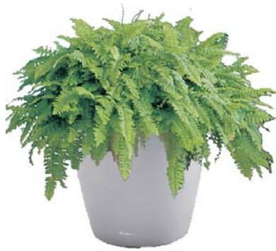
Nephrolepis exaltata Schwertfarn BD