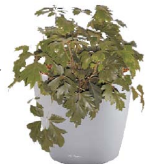
Cissus rhombifolia 'Ellen Danica' Königswein BD, R ●