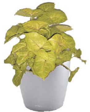
Syngonium podophyllum Pfeilrebe BD, R ●