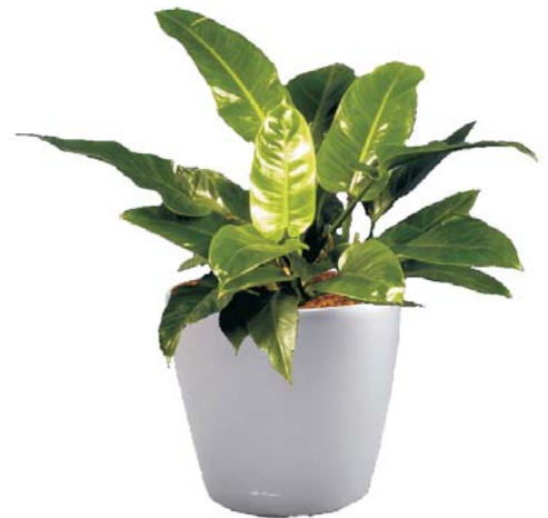
Philodendron 'Imperial Green' Baumfreund MH