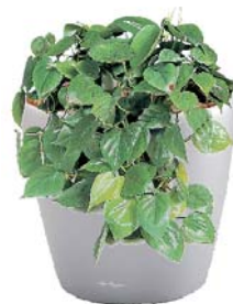
Philodendron scandens Kletterphilodendron BD, R