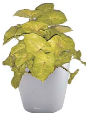
Syngonium podophyllum Pfeilrebe