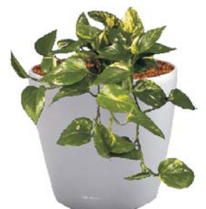
Epipremnum pinnatum Efeutute BD, R