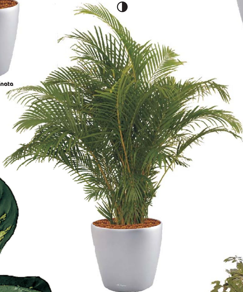
Chrysalidocarpus lutescens 'Areca' Goldfruchtpalme S ●