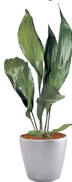
Aspidistra elatior Schusterpalme MH