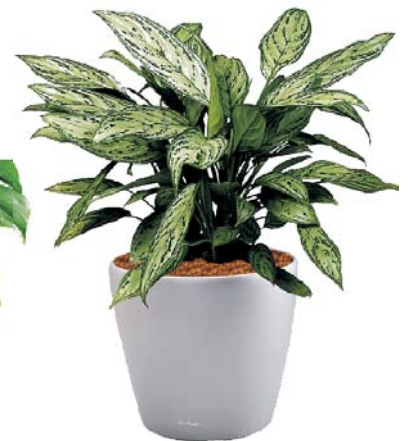
Aglaonema commutatum 'Silver Queen' Kolbenfaden MH