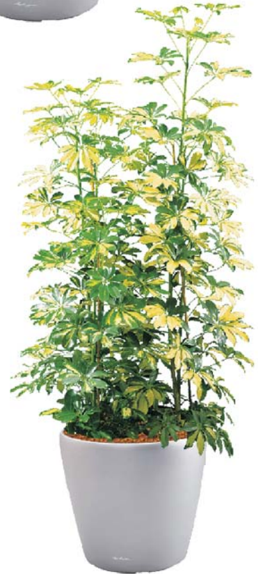
Schefflera arboricola 'Gold Capella' Bunte Strahlenaralie D ○