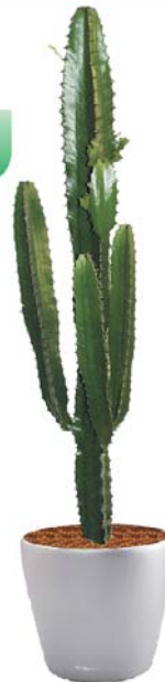
Euphorbia ingens 'Acrucensis'