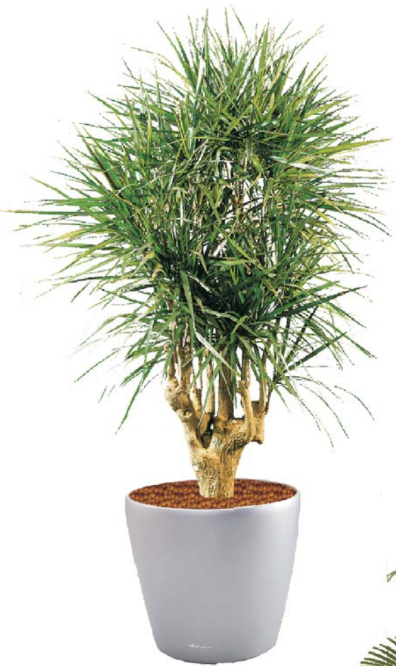
Dracaena marginata Drachenbaum MH, D, S ●