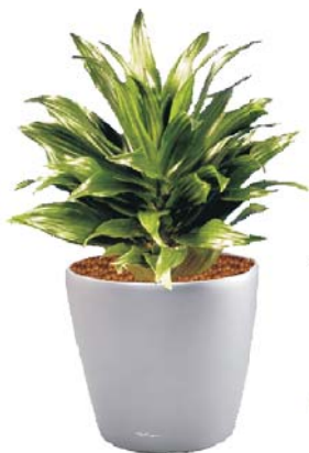
Dracaena deremensis 'Janet Craig compacta' Drachenbaum