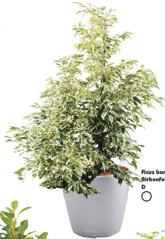
Ficus benjamina 'De Gantel' Birkenfeige gelbbunt D ○