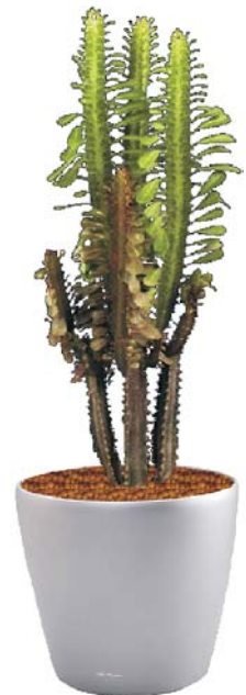
Euphorbia hermetiana trigona Säuleneuphorbia