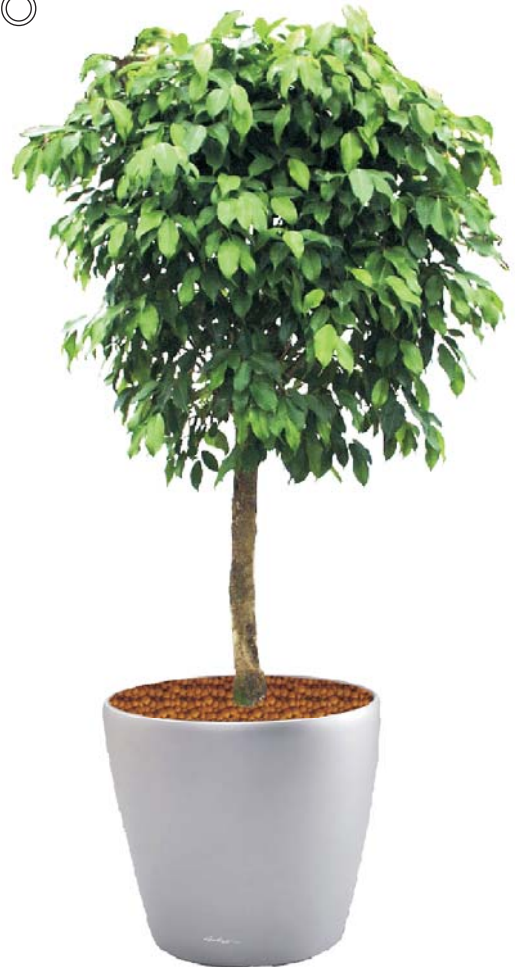
Ficus benjamina Birkenfeige D, S