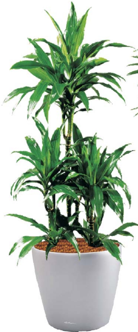
Dracaena fragrans ???????????? Drachenbaum D