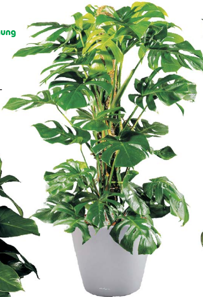
Monstera deliciosa Fensterblatt S, D

Sie bringen die Begeisterung - der Hydro-fachbetrieb das Wissen und geschulte Mitarbeiter.