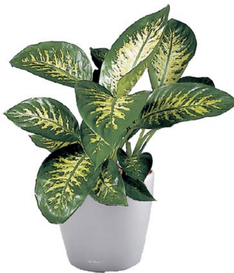
Dieffenbachia amoena 'Tropic White' Dieffenbachie MH