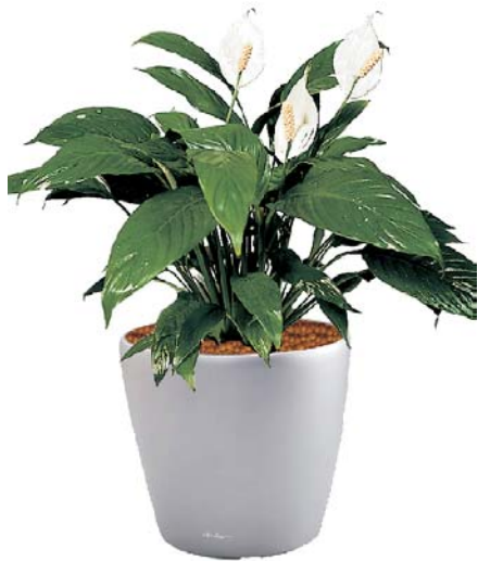
Spathiphyllum floribundum 'Hybride' Einblatt MH