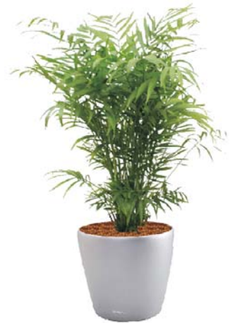
Chamaedorea elegans Bergplame MH