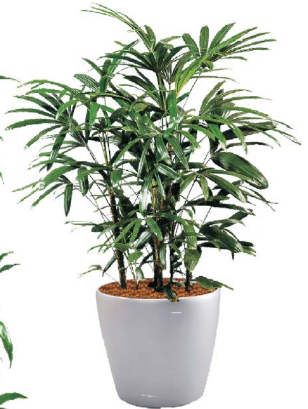
Rhapis excelsa S